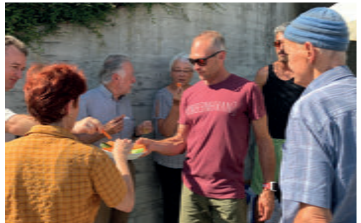
Geniessen ist angesagt