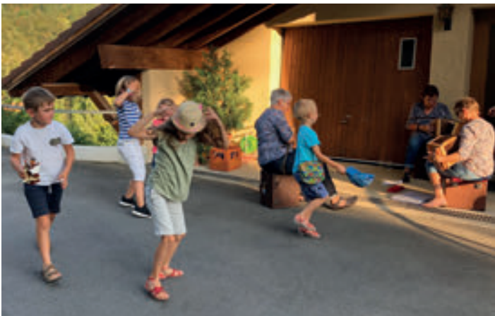
Die Kinder waren tanzfreudiger als die Erwachsenen