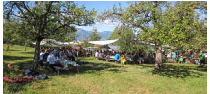
Bereit für den 1. August-Brunch

von Hof zu Hof und spielt sein Stück in der ganzen Schweiz. Wir sind für das leibliche Wohl und die Infrastruktur verantwortlich und er bietet mit einem Theaterstück, das oft auch musikalische Einlagen hat, Unterhaltung.