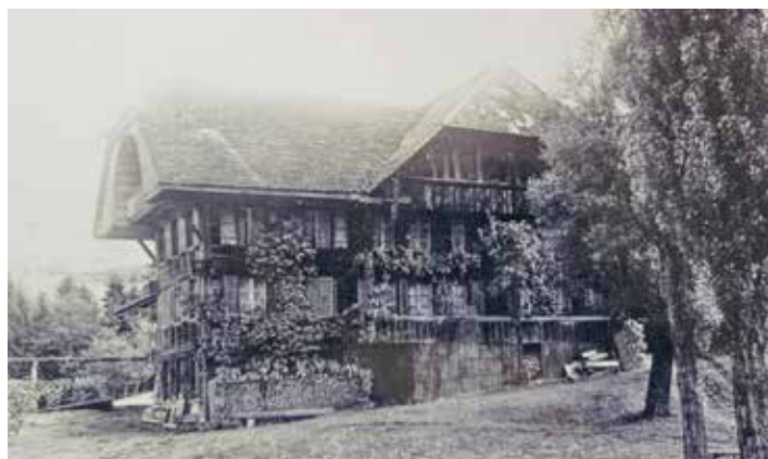
Die Hundschüpfe, um 1910