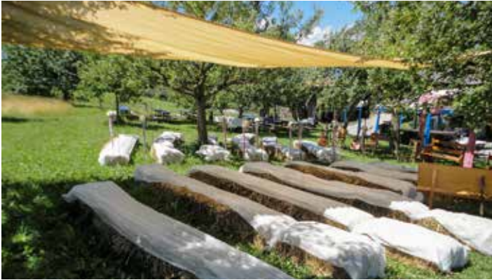
Die Strohballenarena bereit für eine Hochzeitsfeier

Oder dann haben wir ab und zu Spezialwünsche, wie ein Hochzeitspaar, das sich auf einer Weltreise kennen gelernt hat und so an ihrer Hochzeit kulinarisch auch eine Weltreise machte, mit verschiedenen Essensständen, vom Amerikanischen Hamburger über Chinesische Nudeln etc. Solche Anlässe machen die Arbeit spannend nebst Braten mit Karoffelgratin oder Grill und gebrannter Creme die sich als Favoriten mausern und uns bis Ende Saison schon fast zum Hals heraushängen.