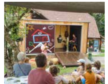
«Heidi» Theater 2022 für Kinder (und Erwachsene), durch die Theaterszene Bern aufgeführt

Seit letztem Jahr gibt es einen kleineren sehr schönen Anlass für Kinder. Die Theaterszene Bern ( www.theaterszene.ch ) spielt an einem Samstag Nachmittag ein Kindertheater in ihrem selbst mitgebrachten Theaterwagen. Letztes Jahr war es Heidi, das sie auf eine geniale und lustige Art inszenierten. Dieses Jahr wird es «Floriset und Rakitaki» am 1. Juli sein. Lassen wir uns überraschen.