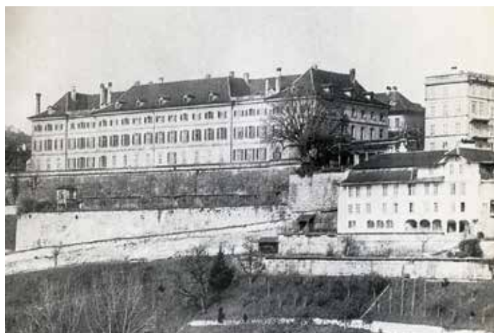
Altes Insepsital Bern vor 1888, da wo heute das Bundeshaus steht