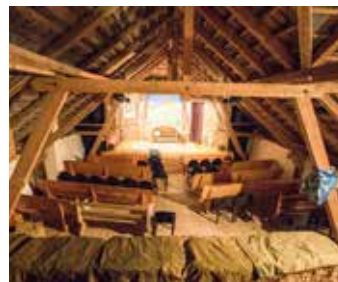
Hoftheater Bühne bereit fürs Publikum