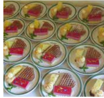
Dessertvariation vom Schalleberg; die gebrannte Crème darf nicht fehlen...

Wir lieben den Austausch, der durch die Gastwirtschaft mit der Bevölkerung entsteht und geben gerne etwas von unserem Leben auf dem Hof weiter. Gespräche und Austausch mit den Kunden können herausfordernd aber oft