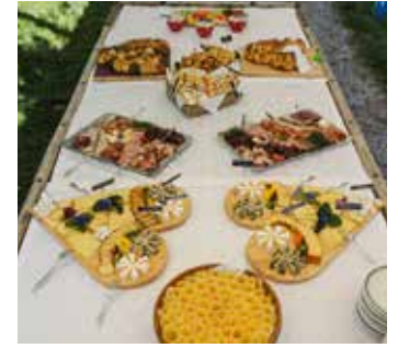
Ein Hochzeitsapéro, alles mit Produkten vom Hof: Fleisch für die kalte Platte, Käse, selbstgebackenes Brot und Apéro-Häppli

auch Augen öffnen in eine Welt, die der Konsument mittlerweile nicht mehr so kennt. Wie bei allem, ist aber auch hier Herzblut sehr wichtig, sonst macht man das nicht lange. Die Tage können schon mal länger werden, als sie sonst schon auf einem Landwirtschaftsbetrieb sind, womit eine innere Motivation wichtig ist.