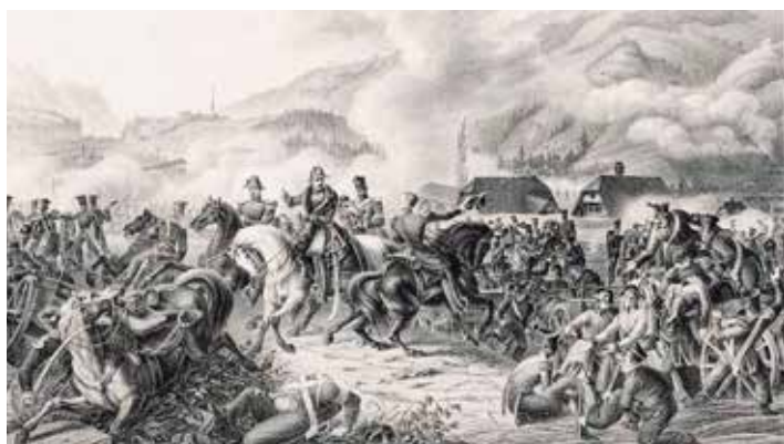
Das Gefecht bei Schüpheim, 23. November 1847