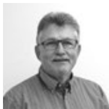
Erich Reinhard Inserate & Produktion